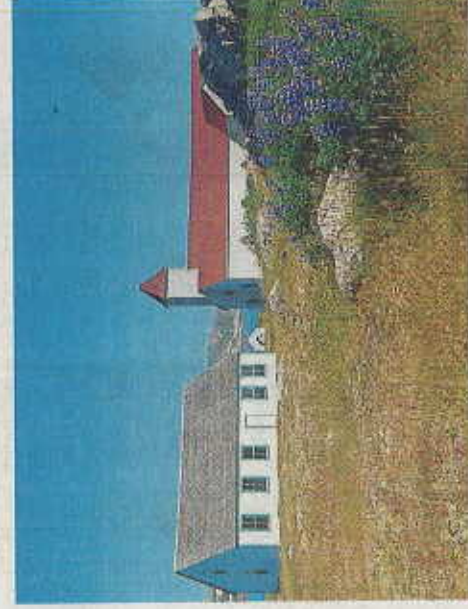
Désertée entre 1967 et 1988, l'île aux Marins renait.