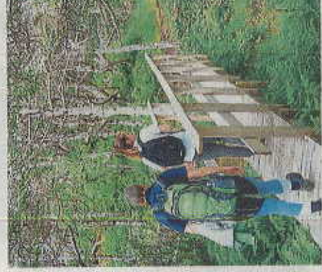
Balade dans la forêt boréale.